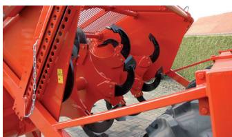
Speciaal ontworpen spitschoppen