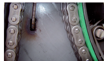
Extra zware aandrijfketting