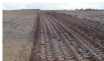
Bandendrukrol zorgt voor betere waterhuishouding