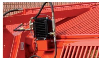
Optie: Oliekoeler voor het koelen van olie aandrijfbak