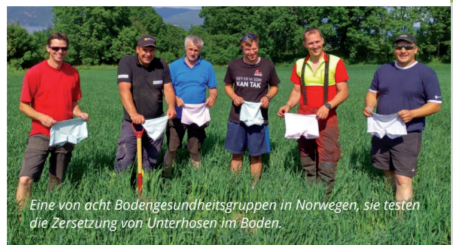
Eine von acht Bodengesundheitsgruppen in Norwegen, sie testen die Zersetzung von Unterhosen im Boden.

Diese Zusammenstellung informiert Sie darüber, wie Sie die Produktion mit den Ideen des Carbon Farming verbinden können. Aber die Kohlenstoffbindung in Böden und Pflanzen ist reversibel, daher ist ein langfristiges neues Management Ihrer Flächen erforderlich. Am besten kombinieren Sie die verschiedenen Maßnahmen!