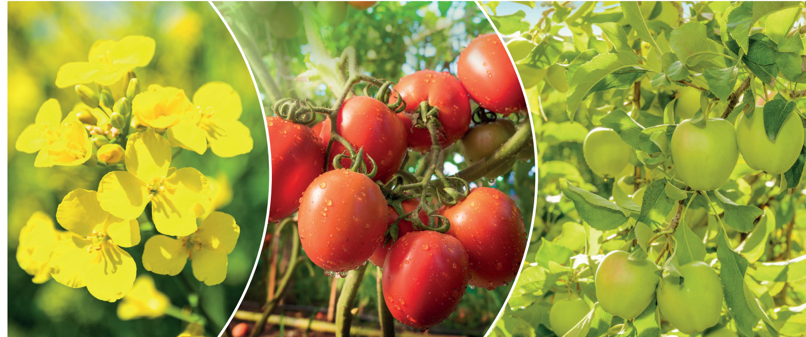
BROCHURE PLANT CARE/LA/B.GERV1 - 16-12-2019

Olmix Group ZA du Haut du Bois 56580 Bréhan - FRANCE Phone: +33 (0)297 388 103 contact@olmix.com www.olmix.com