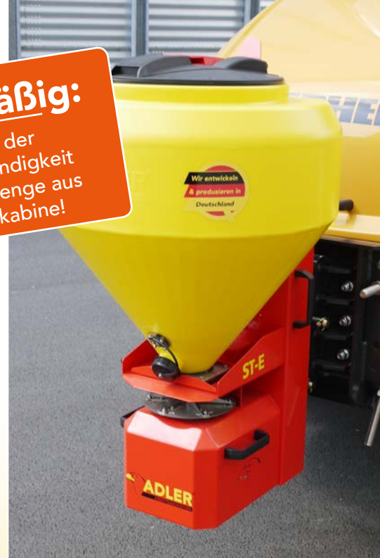
Salzstreuer im Hof-/Radladeranbau