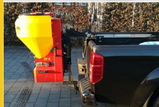
Salzstreuer mit Bordwandhalterung